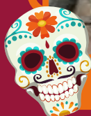
1º lugar catrinas