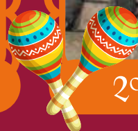
2º lugar catrines