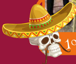
1º lugar catrines