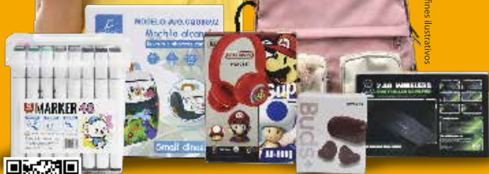
Imagen con fines ilustrativos